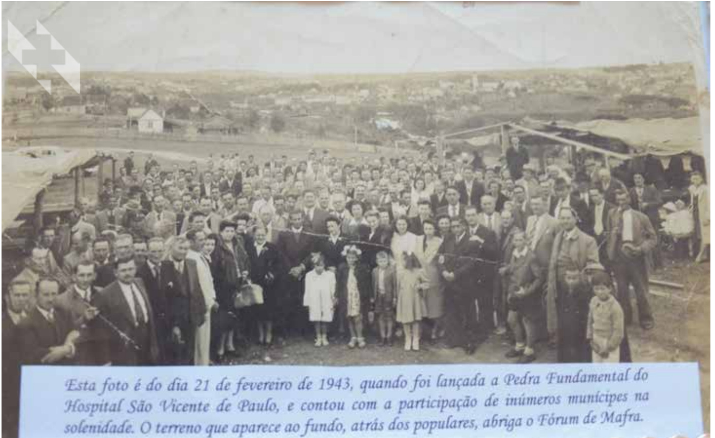
Esta foto é do dia 21 de fevereiro de 1943, quando foi lançada a Pedra Fundamental do Hospital São Vicente de Paulo, e contou com a participação de inúmeros munícipes na solenidade. O terreno que aparece ao fundo, atrás dos populares, abriga o Fórum de Mafra.

Hospital foi construído a partir do esforço e esperanças de