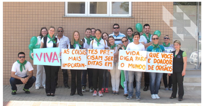
Carreata percorreu ruas centrais de riomafra para sensibilizar a comunidade para a doação de órgãos.