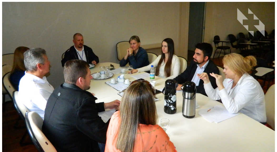
Técnicos manifestaram apoio para o credenciamento de serviços do HSVP junto ao MS

somar aos processos do Centro de Atendimento de Urgência a pacientes com AVC com 10 leitos e de Alta Complexidade em Ortopedia e Traumatologia do Hospital.