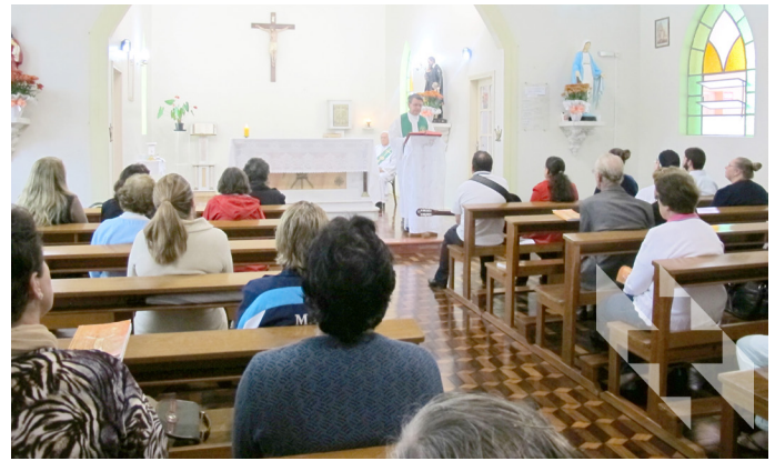
Voluntariado no HSVP é representado por doações da comunidade e trabalhos realizados por diversos grupos de amigos.