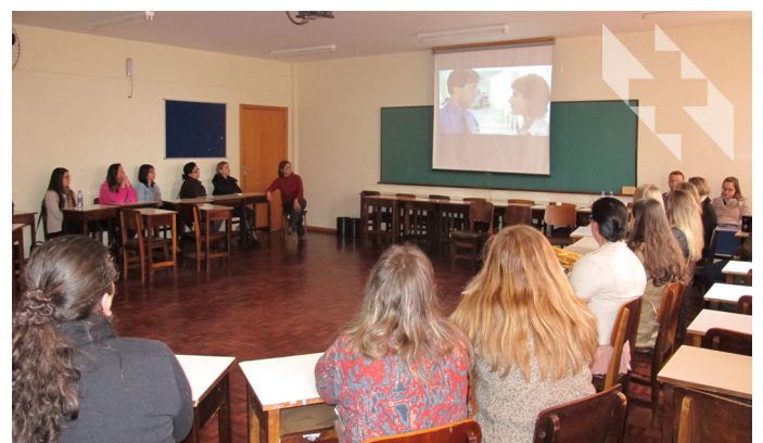
Em oficina para alunos da UnC, comissão de segurança do paciente explica processos e cuidados adotados pelo HSVP

ESTE ESPAÇO ESTÁ DISPONÍVEL PARA ANÚNCIOS!